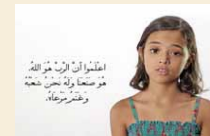
Weet dat de HEERE God is; Hij heeft ons gemaakt en wij zijn Zijn volk en de schapen van Zijn weide.