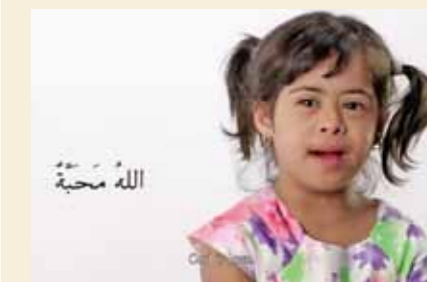
God is liefde

Bijbelwoorden uit de mond van kinderen. We willen 365 clipjes maken, een voor elke dag. Kijk even op ons YouTube kanaal naar de pilot filmpjes. Adopteert u zo'n filmpje voor 100 euro? Ze zullen veelvuldig worden uitgezonden via televisie en sociale media.